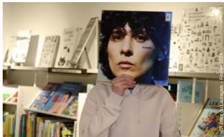
© Terres du Lauragais - Février 2024

Participe au 1 er concours Bookface du réseau des bibliothèques, dans le cadre de la manifestation Partir en livre, pour remporter un Chèque Lire de 100€ !