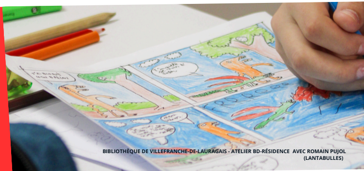
BIBLIOTHÈQUE DE VILLEFRANCHE-DE-LAURAGAIS - ATELIER BD-RÉSIDENTE AVEC ROMAIN PUJOL (LANTABULLES)