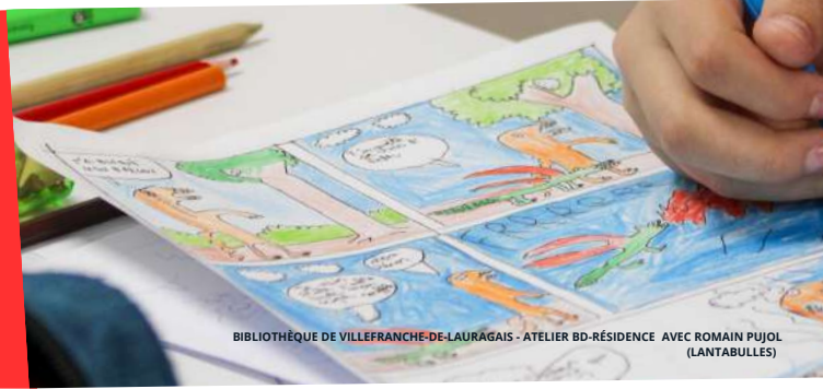
BIBLIOTHÈQUE DE VILLEFRANCHE-DE-LAURAGAIS - ATELIER BD-RÉSIDENCE AVEC ROMAIN PUJOL (LANTABULLES)