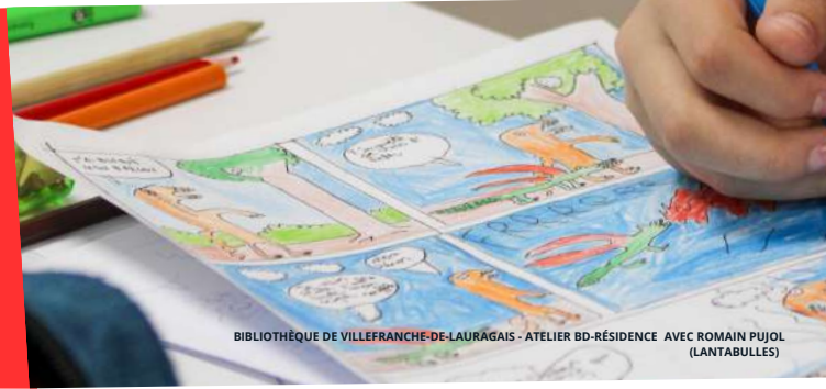
BIBLIOTHÈQUE DE VILLEFRANCHE-DE-LAURAGAIS - ATELIER BD-RÉSIDENTE AVEC ROMAIN PUJOL (LANTABULLES)