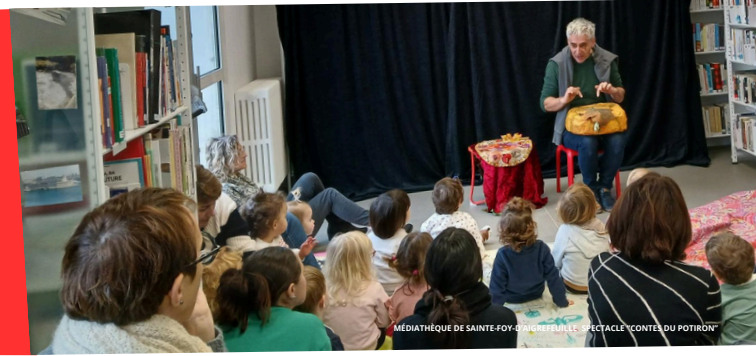
MÉDIATHÈQUE DE SAINTE-FOY-D'AGREFEUILLE - SPECTACLE 'CONTES DU POTIRON'