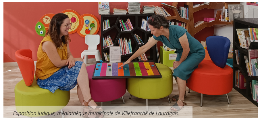
Exposition ludique, médiathèque municipale de Villefranche de Lauragais.